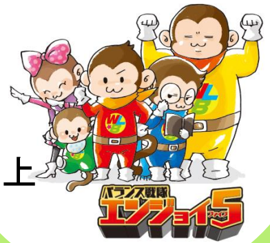
大分労働局 「ワーク・ライフ・バランス」イメージキャラクター